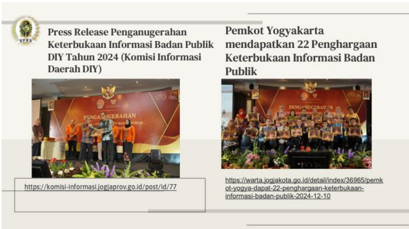
Gambar 1. Prestasi Kota Yogyakarta dalam keterbukaan informasi Publik

Informasi publik terkait pelaksanaan program kota dan kegiatan Walikota/Wakil Walikota juga dapat diakses melalui aplikasi Android Jogja Smart Service dan media sosial Kota Yogyakarta yang dikelola oleh Dinas Komunikasi Informatika dan Persandian Kota Yogyakarta. Saat ini terdapat 5 (lima) platform media sosial yang digunakan oleh Pemerintah Kota Yogyakarta yaitu Twitter (PemkotJogja), Instagram (@pemkotjogja), Facebook (Dinas Komunikasi Informatika dan Persandian Kota Yogyakarta), TikTok (PemkotJogja), serta kanal YouTube YKTV.