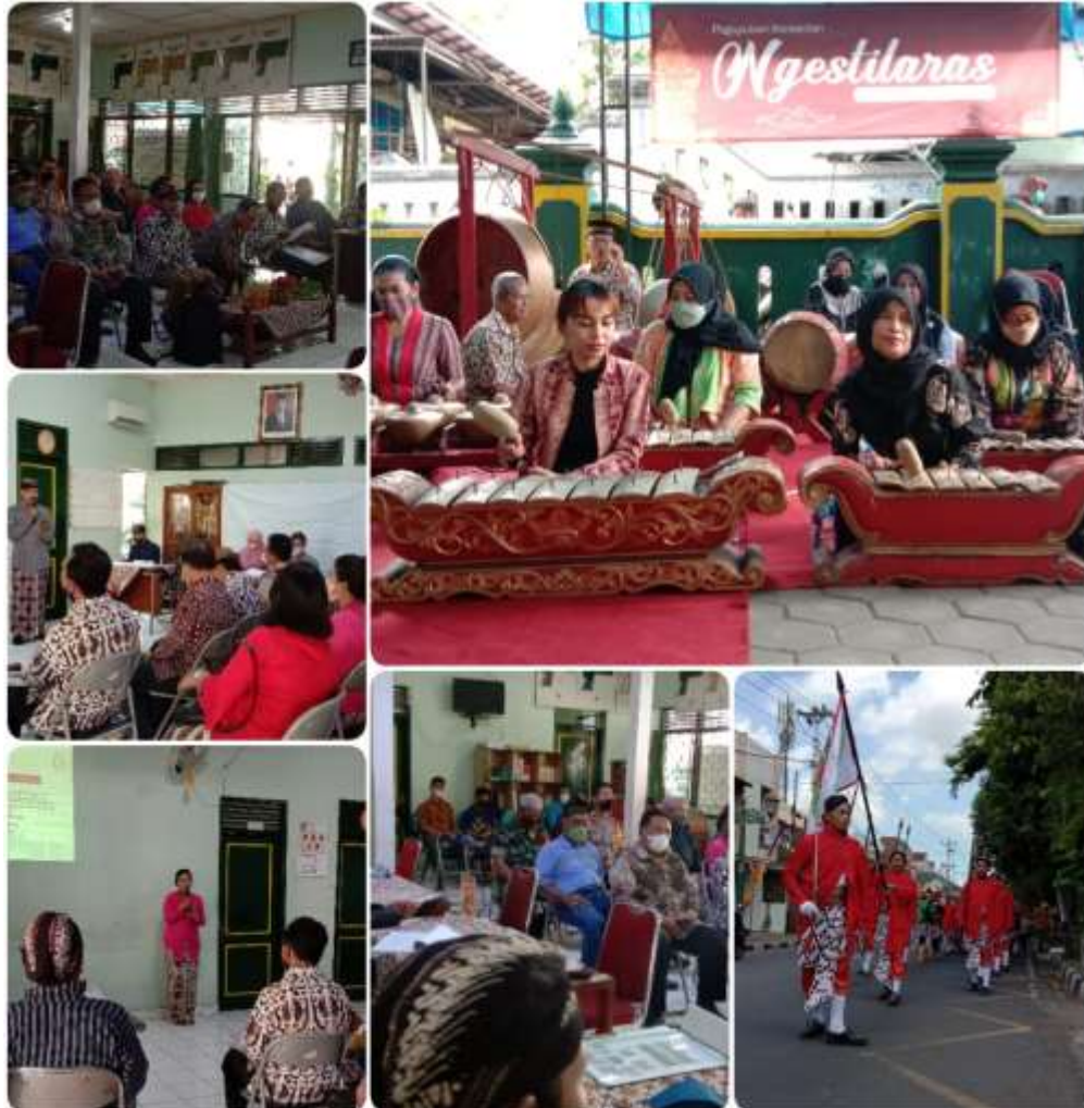
Gambar 4. 2 Gambar Rintisan Kelurahan Budaya di Kelurahan Notoprajan, Ngampilan, Kota Yogyakarta. Rintisan Kelurahan Budaya ini nantinya dapat menjadi salah satu cara untuk melestarikan dan mewariskan kebudayaan Jawa di tengah situasi modernisasi dan globalisasi seperti sekarang.

pengguna aktif Sapa Budaya, kolaborasi lintas sektor yang dihasilkan, jumlah penonton dan karya terpilih KHFF, dampak ekonomi langsung bagi peserta RKB dan UMKM. Hal ini akan memberi landasan evaluasi yang lebih objektif, menggantikan dominasi narasi keberhasilan program dengan data empiris yang kuat.