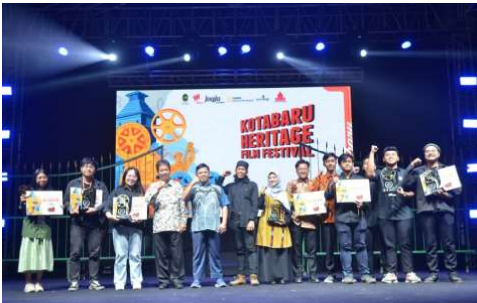
Gambar 4. 1 Gambar Penyelenggaraan Kotabaru Heritage Film Festival 2024 yang berusaha untuk mengakomodasi berbagai macam latar belakang kultur di Indonesia ke dalam medium film.

Selain itu, kegiatan pemajuan heritage lewat Kotabaru Heritage Film Festival yang diselenggarakan sejak 2023, ditandai peningkatan skala: dari antusiasme 171 pendaftar se-Indonesia hingga penambahan rangkaian seperti Sinema Berdansa dan Pasar Kobar dengan melibatkan 31 Rintisan Kelurahan Budaya. Festival ini efektif menanamkan kesadaran heritage melalui medium film dan urban cultural activation , sekaligus mendukung pelaku kuliner lokal via kolaborasi langsung pada saat pelaksanaan acara. Namun kemudian, tinjauan kritisnya adalah kelanjutannya masih tergantung event tahunan: apakah dampak budaya dari festival tersebut dapat terintegrasi lebih luas ke masyarakat sehari-hari, ataukah hanya bersifat insidental semata. Dalam hal ini, perlu diakses dan ditelusuri lebih lanjut untuk memverifikasi indikator keberhasilan seperti jangkauan peserta, kualitas karya, atau kontribusi terhadap sektor ekonomi kreatif.