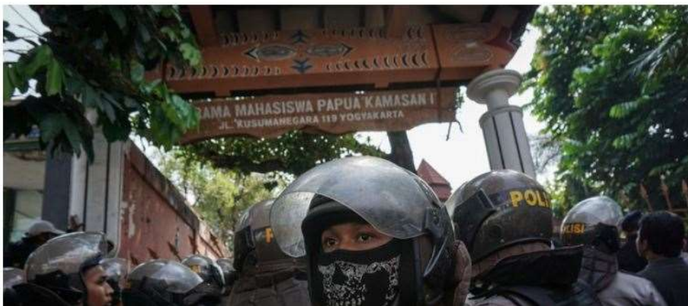
Gambar 3. 7 Gambar Cuplikan berita yang mengabarkan tentang pengepungan mahasiswa Papua di asrama mereka oleh sekelompok orang yang terjadi di Asrama Kamasan, Yogyakarta pada 2016.

Ketegangan antar kelompok berbasis etnis atau kultural ini juga dapat tersulut oleh karena perebutan sumber daya sebagai mata pencaharian. Tidak dapat disangkal bahwasanya beberapa pekerjaan atau area yang digunakan untuk mencari penghidupan ada yang dikuasai kelompok-kelompok dengan basis etnisitas tertentu. Dapat juga beberapa jenis profesi atau pekerjaan juga umumnya dikerjakan oleh orang-orang dari suatu kelompok etnis. Hal ini kadangkala menimbulkan persoalan dan konflik ketika dua kelompok berbeda berusaha memperebutkan sumber daya untuk penghidupan tersebut. Beberapa kali konflik seperti ini terjadi, meski umumnya perselisihan terjadi di antara dua kelompok etnis yang sama-sama merantau ke Yogyakarta. Ketegangan seperti ini juga menjadi pekerjaan rumah bagi pemerintah selaku pemegang otoritas dan