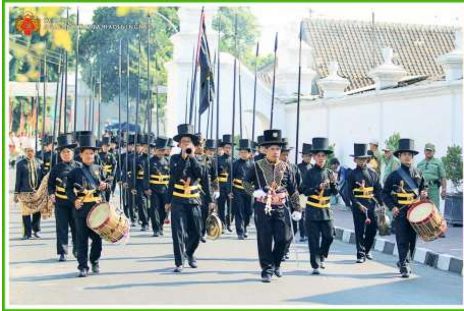
Gambar 3. 2 Gambar Prajurit Bugisan sebagai salah satu pasukan Keraton Yogyakarta yang dahulu adalah orang-orang Bugis yang berasal dari Sulawesi Selatan.