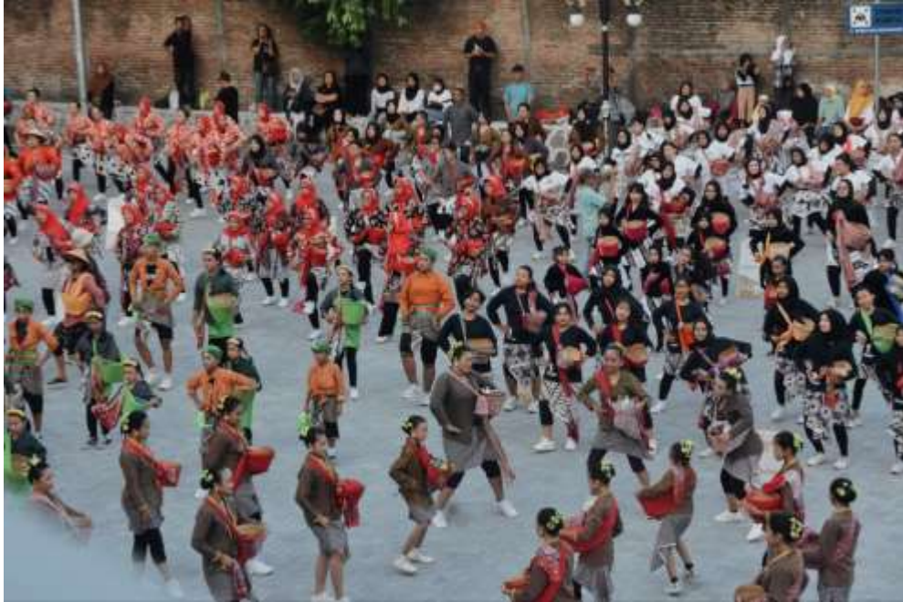
Gambar 4. 5 Gambar Program Kampung Menari menjadi salah satu program andalan dari Dinas Kebudayaan Kota Yogyakarta. Gambar di atas menunjukkan pelaksanaan Kampung Menari yang digelar di Embung Giwangan pada 9 Juni 2024 lalu.