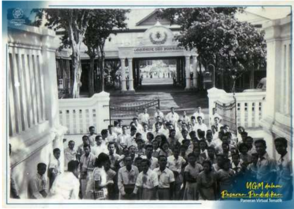
Gambar 2. 5 Gambar Kampus Universitas Gadjah Mada saat masih menempati kompleks Keraton Yogyakarta dalam dekade 1950-an hingga 1960-an, yang mana mahasiswa kampus ini berasal dari berbagai daerah di Indonesia.

Selain tumbuhnya kampus yang begitu masif, pariwisata juga turut mempengaruhi dalam mendorong hadirnya migran dalam jumlah yang tidak sedikit ke Yogyakarta. Memasuki periode Orde Baru, perlahan Yogyakarta tumbuh menjadi kota yang menjadi tujuan wisata. Keberadaan Keraton sebagai simbol dari penjaga budaya Jawa, serta Yogyakarta yang masih menyimpan “keaslian” kota, menjadikan para pelancong dari dalam maupun luar negeri datang ke sini. Otomatis kegiatan ekonomi dalam sektor ini tidak hanya dilakukan oleh penduduk asli Yogyakarta saja, melainkan mengundang para pendatang yang ingin mengadu nasib dan memperoleh penghidupan di kota ini. Maka tidak heran misalnya pada waktu belakangan ini, para pedagang kaki lima maupun penjaja segala rupa makanan, pernak-pernik, maupun oleh-oleh di seputaran Malioboro banyak dikerjakan oleh para pendatang dari luar Yogyakarta. Luas Kota Yogyakarta yang menjadi wilayah terkecil di antara kabupaten/kota lainnya di