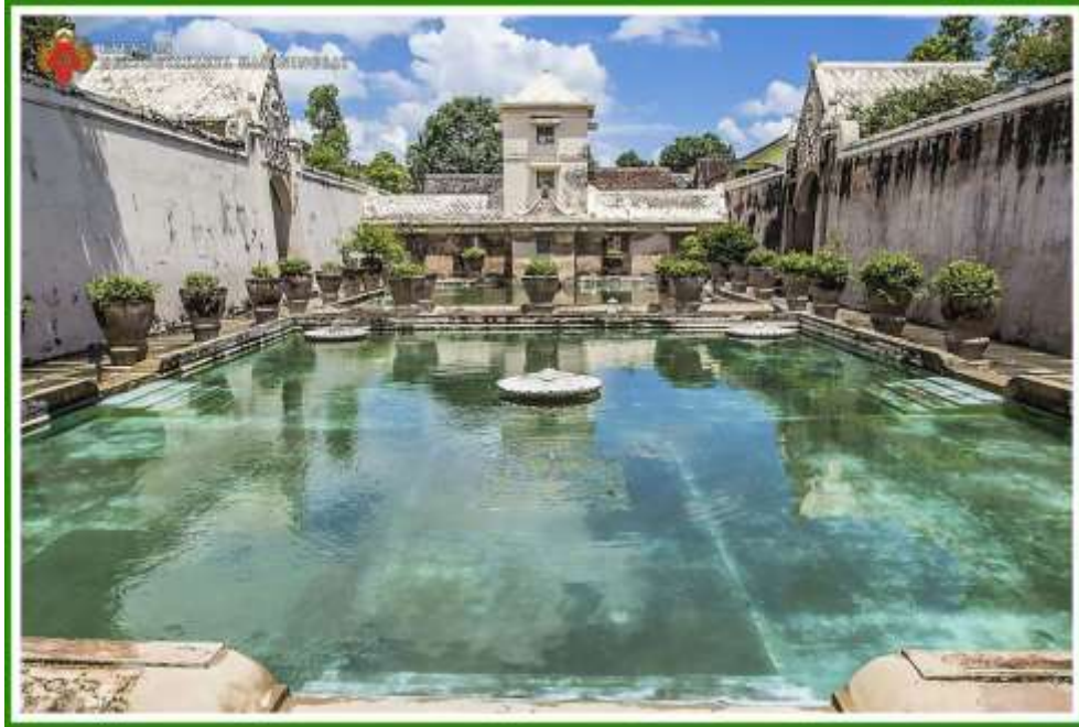
Gambar 3. 5 Gambar Tamansari yang menjadi tempat pemandian sekaligus taman air milik Keraton Kasultanan Yogyakarta. Arsitektur Tamansari mengadopsi gaya Eropa, dirancang oleh seorang arsitek asal Portugis.

kalangan, baik itu di Keraton yang dianggap sebagai pusat kebudayaan sekaligus pusat kekuasaan politik, maupun pada masyarakat umum secara luas yang menjadi warga kota.