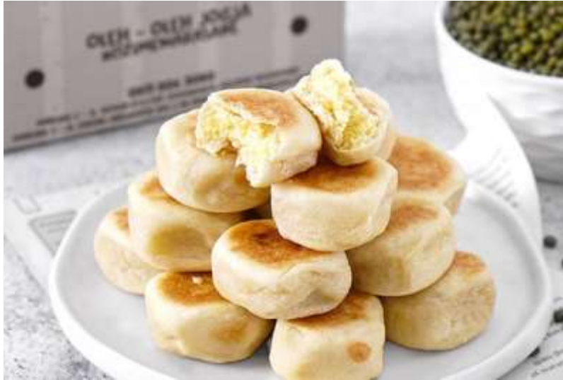
Gambar 3. 1 Gambar Bakpia sebagai makanan hasil proses akulturasi antara kebudayaan Tionghoa dan Indonesia. Kini menjadi makanan khas sekaligus ikon Yogyakarta.

menjadi kacang hijau, menyesuaikan dengan masyarakat umum Yogyakarta yang mayoritas adalah penganut Islam. Segera saja setelah itu bakpia menjadi makanan khas Yogyakarta dan buah tangan andalan bagi para wisatawan yang melancong di kota ini (Martiana dan Rahadjeng 2024:383-384).