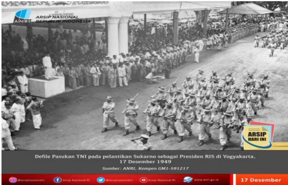
Gambar 2. 4 Gambar Pasukan Tentara Nasional Indonesia yang sedang dilantik oleh Presiden Sukarno ketika Yogyakarta menjadi ibukota Republik Indonesia sepanjang 1946 hingga 1949.

membuat orang-orang dari wilayah pedesaan dan kabupaten memilih mencari penghidupan baru di Yogyakarta sebagai kota sekaligus pusat kerajaan.