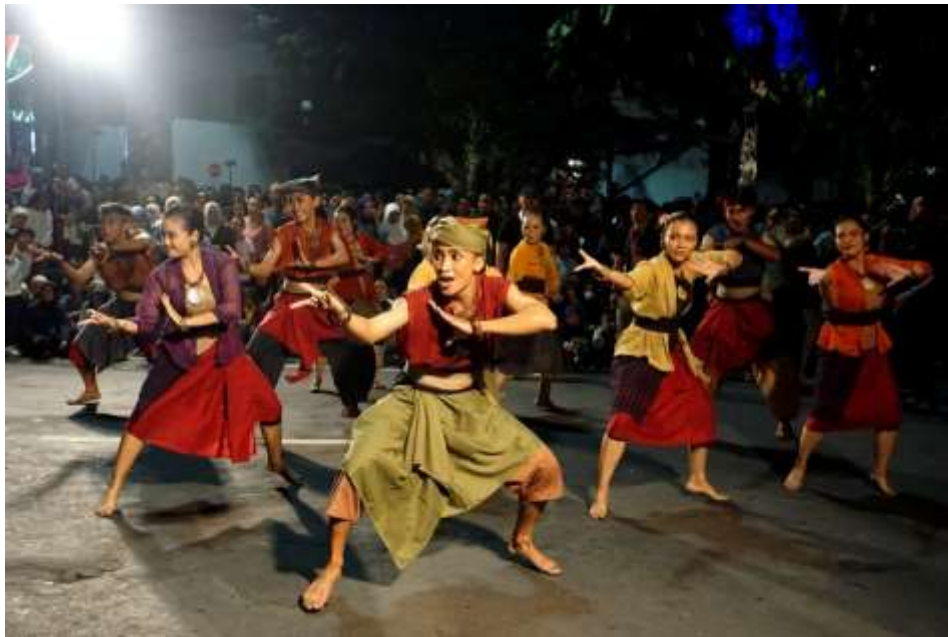
Gambar 4. 3 Gambar Perhelatan Jogja Cross Culture yang diselenggarakan di Jalan Malioboro, Yogyakarta pada 25 Mei 2024 sebagai salah satu program andalan dalam pengembangan kebudayaan di bawah Dinas Kebudayaan Kota Yogyakarta.

Keberadaan ruang budaya yang nantinya sekaligus menjadi ruang terbuka hijau ini penting guna memfasilitasi kebutuhan ruang ekspresi diri dan budaya bagi masyarakat secara umum. Selama ini banyak dari mereka yang merasa bahwa ruang-ruang budaya yang ada masih terbatas, entah itu karena bentuk ruangnya formal, berbayar mahal, terbatas pada kepemilikan pribadi, maupun hal-hal lain yang pada akhirnya membuat banyak dari mereka, terutama orang-orang muda, melakukan ekspresi diri dan budaya yang menyalahi dan melanggar aturan dan ketertiban umum. Persoalan inilah yang kiranya dapat dipecahkan dan diselesaikan oleh pemerintah kota mengingat kebutuhan akan ruang-ruang budaya yang aman, inklusif, dan terbuka amat dibutuhkan terutama oleh generasi muda yang sedang dalam fase bersemangat mengekspresikan dirinya melalui kegiatan-kegiatan kebudayaan maupun kesenian.