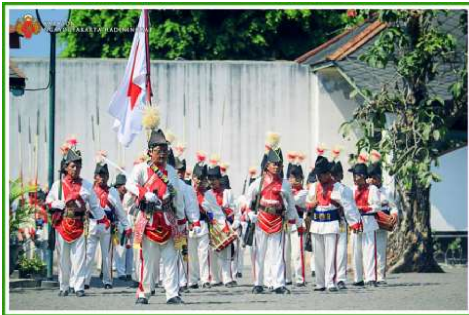
Gambar 3. 3 Gambar Prajurit Dhaengan sebagai salah satu pasukan Keraton Yogyakarta yang dahulu adalah orang-orang Makassar yang berasal dari Sulawesi Selatan.