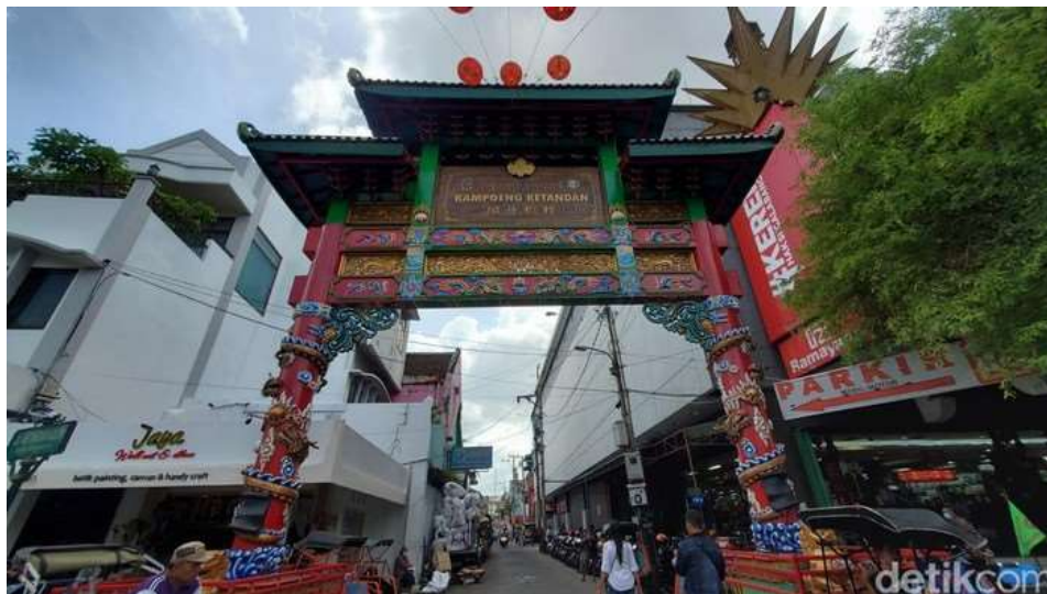
Gambar 2. 2 Gambar Kampung Ketandan yang terletak di Kawasan Malioboro menjadi bukti bagaimana kehidupan multikultur yang ada di Kota Yogyakarta telah berlangsung selama beberapa abad lamanya.

Kendati sering disebut sebagai jantung sekaligus pusat kebudayaan Jawa, sudah sejak awal berdiri Yogyakarta menjadi wilayah yang terbuka bagi kaum pendatang. Tercatat orang-orang Tionghoa sudah berdiam diri di Yogyakarta sejak abad ke-18. Para migran pedagang ini sudah lama dikenal sebagai kelompok yang menjadi perantara, terutama dalam kegiatan pertukaran komoditas dan perdagangan. Kelompok Tionghoa ditempatkan dalam sebuah wilayah tertentu untuk tinggal bersama-sama di sana, yang kelak kemudian dikenal sebagai Kampung Ketandan. Letaknya berada di sisi utara Keraton Yogyakarta.