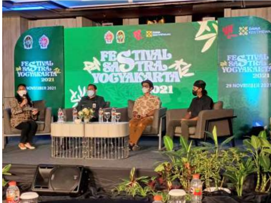
Gambar 5. 5 Gambar Penyelenggaraan Festival Sastra Yogyakarta yang berada di bawah naungan Dinas Kebudayaan Kota Yogyakarta ini dapat menjadi salah satu percontohan bagi penyelenggaraan Gelar Budaya Nusantara yang nantinya akan lebih beragam dalam hal asal daerah untuk konten-konten acara yang dihadirkan, yang dapat melibatkan partisipasi aktif para mahasiswa dari berbagai daerah di Indonesia.