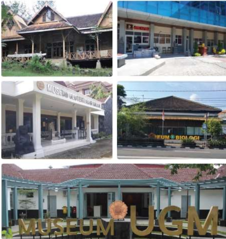
Gambar 5. 2 Gambar Beberapa museum milik kampus-kampus yang ada di Yogyakarta. Museum kampus ini kemudian dapat menjadi prototipe bagi Museum Pendidikan Tinggi yang nantinya akan dapat lebih komprehensif dan lengkap.

ibukota pendidikan Indonesia, karena selain banyaknya kampus dan sekolah, keberadaan pelajar dari berbagai daerah di Nusantara, juga menunjukkan hasil bahwa dari kota inilah lahir para pemimpin juga pembangun yang berkontribusi bagi kemajuan negara.