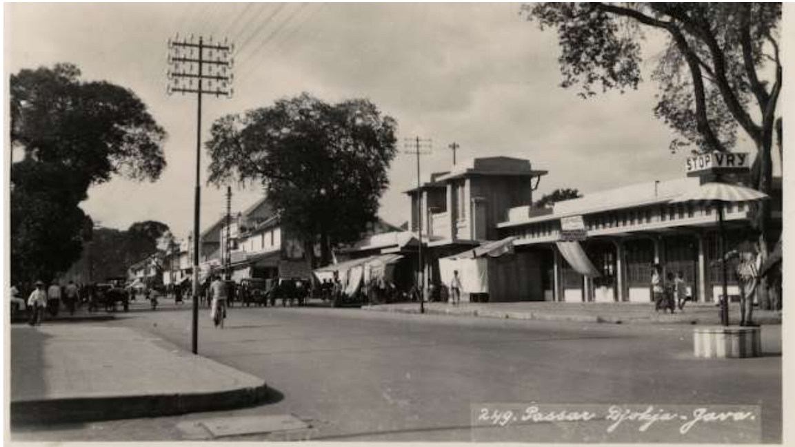
Gambar 2. 6 Gambar Pasar Beringharjo yang terletak di sebelah selatan kawasan Malioboro. Sejak masa kolonial, Kota Yogyakarta telah memiliki daya tariknya tersendiri yang menyebabkan arus besar migrasi dari berbagai daerah terus menerus memenuhi kota ini pasca Indonesia merdeka. (Sumber: Jejak Kolonial)

Daerah Istimewa Yogyakarta dipenuhi dengan penduduk yang tersebar ke dalam 14 kemantren (kecamatan).