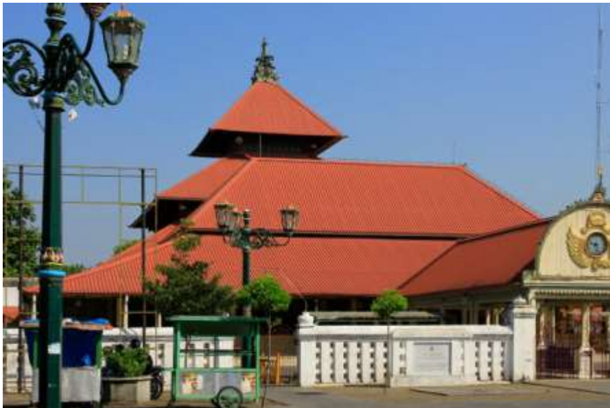
Gambar 4. 6 Gambar Masjid Gedhe Kauman beserta Kampung Kauman di sisi belakangnya yang menjadi salah satu kawasan bernilai historis yang menjadi saksi bagi jalannya sejarah Kota Yogyakarta. Kawasan ini menjadi salah satu tujuan pengembangan kebudayaan yang ada di Kota Yogyakarta.

Dari dokumen yang sama kemudian dapat diambil setidaknya empat poin besar yang dapat menjadi saran bagi perbaikan ke depannya. Pertama, prioritaskan skema rehabilitasi dan perlindungan cagar budaya permukiman. Masih minimnya intensitas rehabilitasi cagar budaya khususnya di kawasan padat warisan seperti Kotagede, Purbayan, Kauman, dll. menunjukkan perlunya penyusunan rencana induk konservasi kawasan heritage berbasis zonasi mikro. Selain itu juga mesti dilakukan penguatan kolaborasi dengan Balai Pelestarian Cagar Budaya (BPCB), komunitas lokal, arsitek konservasi, serta pelibatan aktif pemilik rumah cagar budaya melalui skema insentif pajak atau bantuan teknis rehabilitasi ringan. Perluasan program pendampingan teknis konservasi berbasis kampung juga mesti dilakukan. Kebijakan ini penting agar masyarakat pemilik cagar budaya tidak terbebani biaya pemeliharaan pribadi, serta mengurangi risiko hilangnya fisik bangunan bersejarah akibat keterbatasan ekonomi.