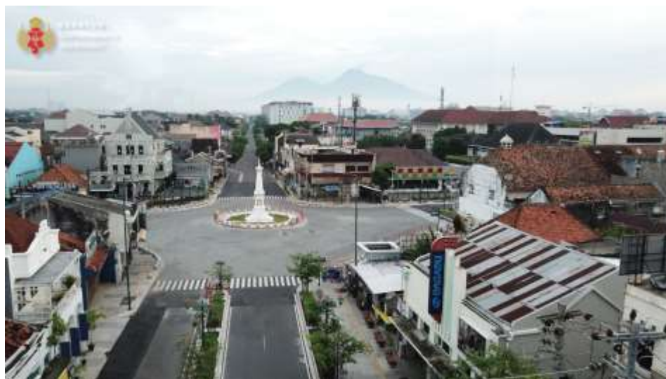
Gambar 5. 4 Gambar Tugu Yogyakarta yang menjadi salah satu dari bagian Sumbu Filosofi Yogyakarta, selain Gunung Merapi, Keraton, dan Panggung Krapyak.

filosofis yang ada di Kota Yogyakarta. Peserta diutamakan mereka yang berasal dari luar daerah, terutama sekali para mahasiswa dan pelajar yang sedang menempuh pendidikan di Kota Yogyakarta. Lantas pada hari penyelenggaraan, mereka diajak tur dipimpin oleh pemandu menelusuri titik-titik penting dalam sumbu filosofis Yogyakarta. Melalui tur ini, tiap peserta diedukasi mengenai nilai-nilai fundamental dan luhur kebudayaan Jawa, sebuah tempat yang mana saat ini mereka menetap dan tinggal untuk beberapa waktu ke depan. Di akhir tur, peserta diminta membuat refleksi, baik melalui tulisan maupun audio visual mengenai kesan, makna, dan pelajaran yang mereka peroleh setelah mengikuti tur tersebut.