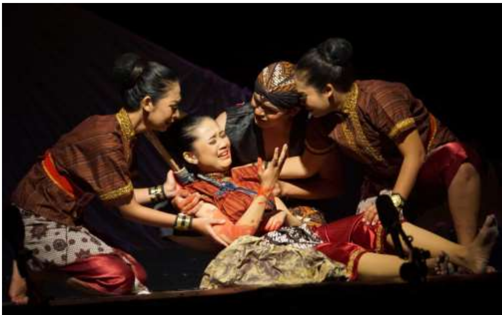
Gambar 4. 4 Gambar Perhelatan Festival Ketoprak Yogyakarta yang mengambil lakon sejarah Kerajaan Mataram yang dipentaskan pada 2022 lalu. Festival ini adalah salah satu program di bawah Dinas Kebudayaan Kota Yogyakarta untuk terus melestarikan kebudayaan panggung khas Yogyakarta, dengan melibatkan tiap kemandren untuk tampil sebagai peserta.

kebudayaan. Sejatinya, tanpa perlu didorong saja mereka sudah banyak melakukan inisiatif dan kerja-kerja kebudayaan di lingkup yang biasanya kecil, lokal, dan mengakar di sekitar tempat mereka tinggal dan melakukan kerja kebudayaan. Kota Yogyakarta sendiri dihuni oleh banyak sekali para pegiat kebudayaan, dengan segala bidang kebudayaannya masing-masing yang tersebar di seantero kota. Selama ini mereka bergerak secara swadaya alias mandiri untuk menyelenggarakan kegiatan-kegiatan yang bersifat pembinaan, produksi karya, sampai pertunjukan bagi masyarakat umum. Selain sebagai sarana pengembangan diri para pekerja kebudayaan itu sendiri, banyak dari mereka juga melakukannya untuk mendorong pemajuan kebudayaan pada masyarakat sekitar tempat mereka tinggal.