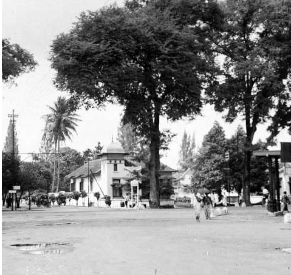
Gambar 2. 3 Gambar Kawasan Kotabaru yang pada masa kolonial sekitar awal abad ke-20 menjadi permukiman bagi kelompok Eropa, selain juga Benteng Vredeburg yang pada masa sebelumnya juga menjadi tempat tinggal bagi kaum kulit putih.

Berpindahnya ibukota ke Yogyakarta tidak hanya dilakukan oleh perangkat pemerintahan saja, melainkan banyak penduduk juga turut hijrah ke sini. Mereka yang mengungsi adalah penduduk yang berasal dari wilayah yang telah diduduki tentara Belanda, utamanya Jakarta dan Jawa Barat. Segera saja Yogyakarta menjadi kota yang penuh dengan penduduk yang berasal dari luar kota, yang berharap mencari perlindungan dan penghidupan di tengah situasi perang dan Revolusi yang tengah berkecamuk. Tidak ketinggalan, migran yang berasal dari dalam wilayah Kasultanan sendiri jumlahnya tidak kalah sedikit. Hancurnya perekonomian dan krisis pangan yang terjadi semasa penjajahan Jepang