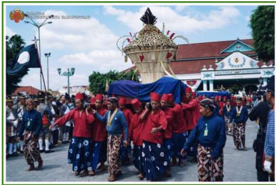
Gambar 3. 4 Gambar Upacara Garebeg yang rutin dilakukan setiap tahun oleh Kasultanan Yogyakarta, yang mana upacara tersebut kental dengan nuansa akulturasi budaya, terutama dari gunungan yang diberikan oleh Sultan kepada rakyatnya tersebut.

Jika menilik lebih jauh dan lebar lagi, secara umum kebudayaan Jawa yang berkembang di Yogyakarta itu sendiri merupakan hasil akulturasi dan penyerapan dari berbagai kebudayaan besar lainnya. Akulturasi itu antara lain terwujud dalam segi arsitektur, di mana terjadi kombinasi bentuk rumah yang memadukan model Jawa dan Eropa, yang kemudian dikenal sebagai bangunan Indis. Kebudayaan Hindu Buddha (India) maupun Islam (Timur Tengah) juga banyak tercermin dalam berbagai bentuk material maupun ritus kebudayaan Jawa itu sendiri. Semisal upacara Garebeg Maulud , Garebeg Sawal , dan Garebeg Besar yang rutin diselenggarakan setiap tahunnya oleh Keraton Yogyakarta menandai suatu ritus yang merupakan percampuran antara tradisi Hindu dan kepercayaan Islam.