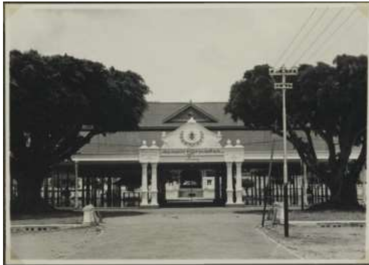
Gambar 2. 1 Gambar Keraton Kasultanan Yogyakarta sebagai pusat dari peradaban sekaligus jantung bagi kebudayaan Jawa. Di sinilah kemudian apa yang disebut sebagai Kota Yogyakarta lahir sebagai sebuah kotapraja di masa kemerdekaan Indonesia.

Sejarah Kota Yogyakarta tidak bisa dilepaskan dari berdirinya Kerajaan Mataram Islam pada dekade-dekade akhir abad ke-16. Raden Danang Sutawijaya yang kemudian bergelar Panembahan Senapati membuka suatu wilayah yang sebelumnya dikenal sebagai Alas Mentaok sebagai tempat berdirinya istana kerajaan. Wilayah yang kini masuk dalam Kemantren Kotagede tersebut menjadi penanda bagi berdirinya sebuah kerajaan yang kelak akan dianggap sebagai jantung sekaligus pusat dari kebudayaan Jawa. Berselang dua abad dari berdirinya Mataram Islam, kerajaan tersebut mengalami banyak dinamika dan pergolakan yang kemudian memaksa terjadinya pembagian kekuasaan. Kerajaan akhirnya dipecah menjadi dua pada 1755 melalui sebuah kesepakatan yang dikenal sebagai Perjanjian Giyanti, yang mana membuat Kasultanan Mataram berubah wujud menjadi dua entitas: Kasunanan Surakarta dan Kasultanan Yogyakarta.