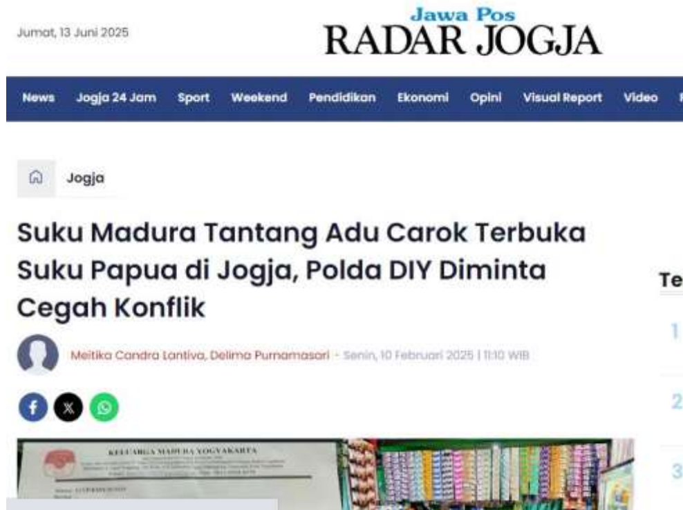
Gambar 3. 6 Gambar Berita mengenai konflik antar etnis yaitu Madura versus Papua yang sempat menghebohkan warga Yogyakarta pada Februari 2025 lalu.

setiap saat. Beberapa hal di bawah ini menjelaskan beberapa hal yang dapat memicu pecahnya konflik berbasiskan identitas budaya, yang kemunculannya dapat dicegah dan permasalahannya dapat dimitigasi sejak awal.