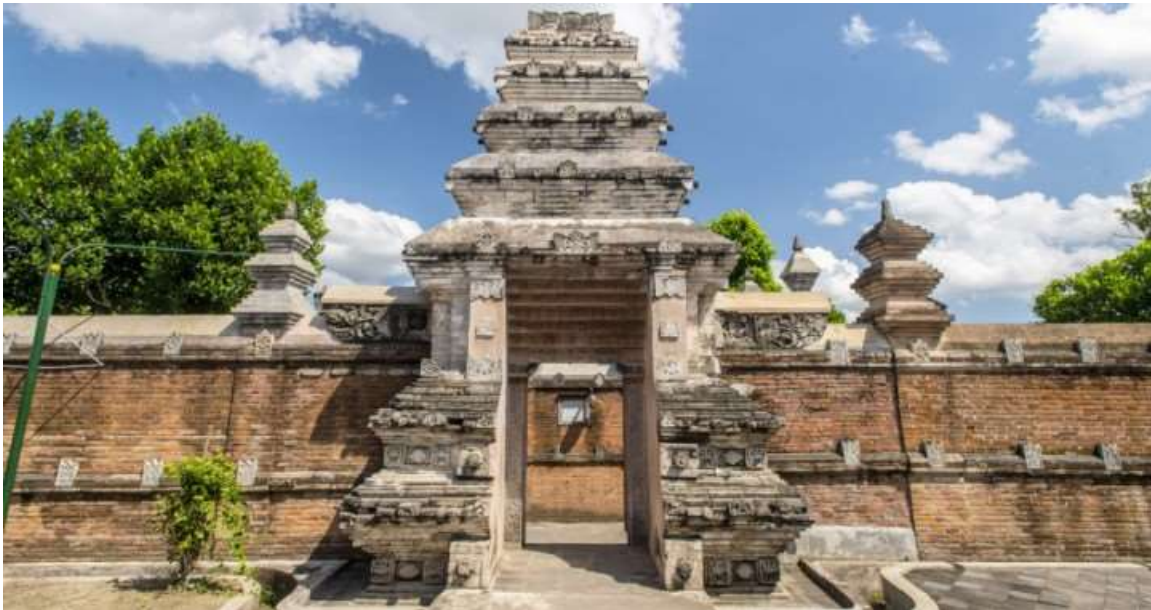
Gambar 5. 3 Gambar Pintu masuk Makam Raja-raja Mataram di Kotagede, Yogyakarta. Kawasan ini merupakan bekas pusat pemerintahan Kerajaan Mataram Islam pada sekitar abad ke-16 sebelum akhirnya pecah menjadi dua kerajaan.

kuno di masa klasik. Dari sini nantinya mereka dapat mengetahui sejarah panjang kota yang saat ini mereka huni untuk jangka waktu beberapa tahun ke depan. Di akhir tur, peserta diminta membuat refleksi, baik melalui tulisan maupun audio visual mengenai kesan, makna, dan pelajaran yang mereka peroleh setelah mengikuti tur tersebut.